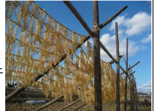
(上写真)よりぼし大根の稲架かけの様子